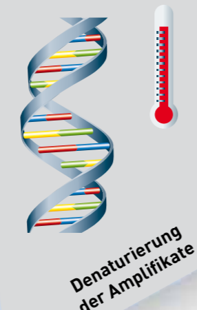
Denaturierung der Amplifikate

Die isolierte Nukleinsäure wird in einer anschließenden Amplifikationsreaktion im FluoroCycler ® selektiv vermehrt.