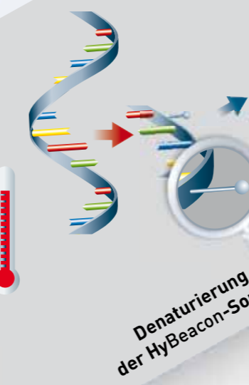
Denaturierung der HyBeacon-Sonden

HyBeacon -Sonden sind einzelsträngige fluoreszenzmarkierte Sonden, die komplementär zur amplifizierten Nukleinsäure sind. Liegen die HyBeacon -Sonden im ungebundenen Zustand vor, kann das Fluorophor nicht zur Fluoreszenzemission angeregt werden. Nach Hybridisierung mit dem Amplifikat ist eine Anregung und folglich eine Messung der Fluoreszenz möglich. Während der anschließenden Schmelzkurvenanalyse lösen sich die HyBeacon -Sonden bei einer spezifischen Temperatur vom Amplifikat. Dies führt zu einzelsträngigen Sonden und somit zu einer sofortigen Abnahme der Fluoreszenz.