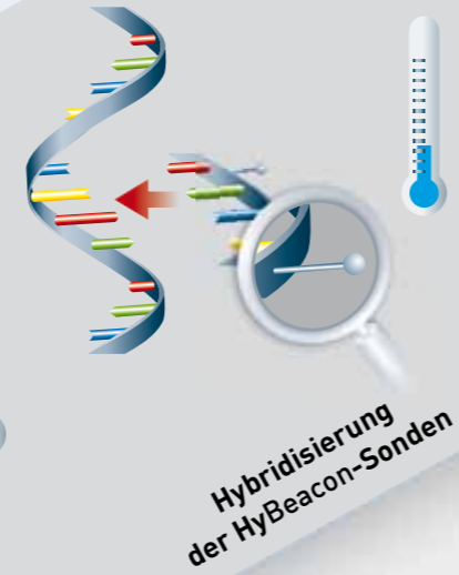
Hybridisierung der HyBeacon-Sonden